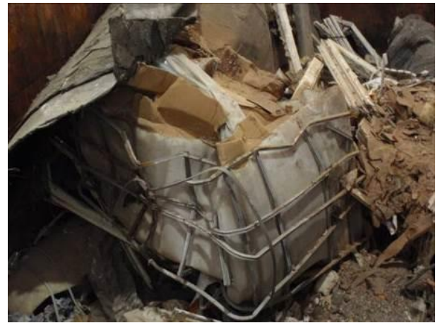
Sperrmüll mit Metall