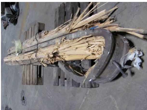
Nicht zerkleinerbare Störstoffe