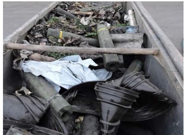
Sehr große, sperrige Stoffe; Rollen