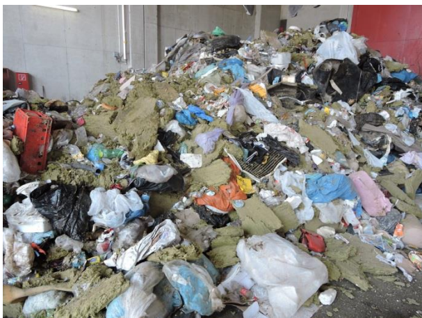
Mineralische Dämmstoffe (Glaswolle/Steinwolle)