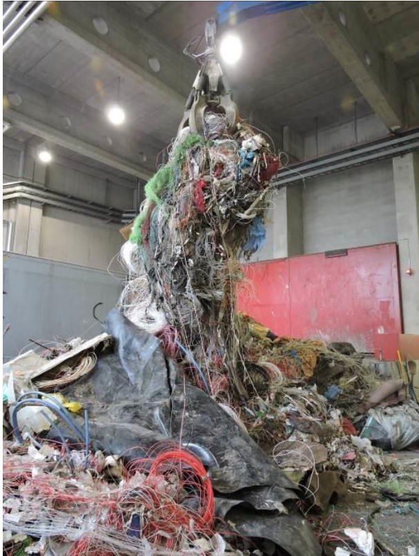
Lange Bänder und Geflechte

Beispiele für Störstoffe, die nicht übernommen werden: