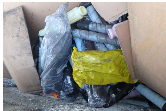
Stoffe, die zur Verpuffung neigen (z.B. Toner)