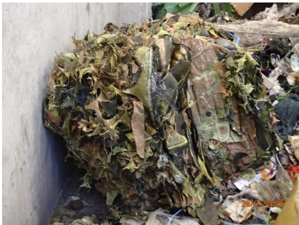
Glasfasergewebe in Ballen gepresst