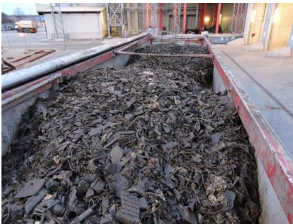
Sonderfraktionen (z.B. Gummimonofraktionen)